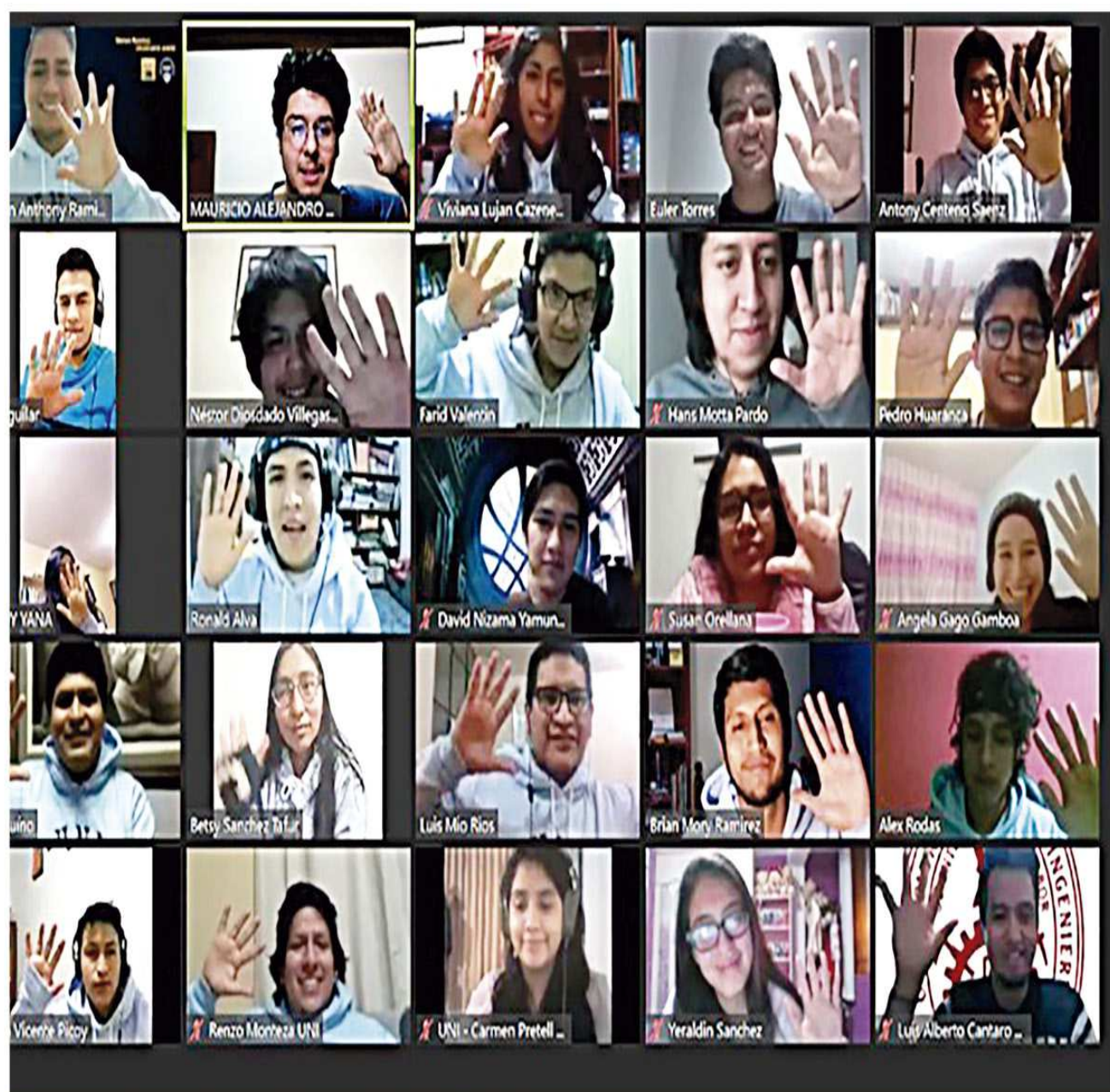
Alumnos agradecieron el apoyo de las autoridades de la Facultad.

Centro de Estudiantes de la FIC logró quinto triunfo consecutivo en evento académico universitario