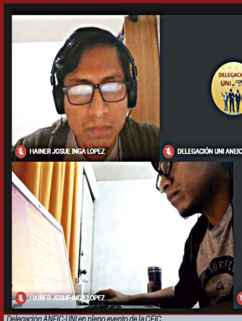
Delegación ANEIC-UNI en pleno evento de la CEIC.