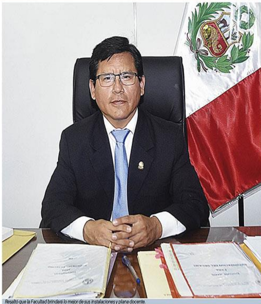
Resaltó que la Facultad brindará lo mejor de sus instalaciones y plana docente.